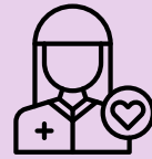
4. 개인지원 및 권리 옹호